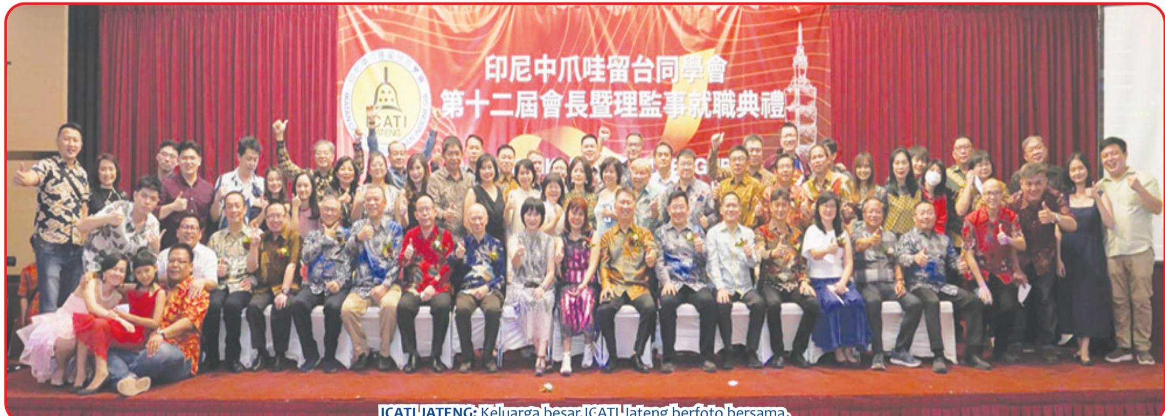
ICATI/JATENG: Keluarga besar ICATI Jateng berfoto bersama.

SEMARANG (IM) - Upacara pelantikan dewan pengurus dan pengawas Ikatan Citra Alumni Taiwan Indonesia Jawa Tengah (ICATI Jateng) berlangsung Sabtu (24/9) malam lalu di Kedai 168 Semarang.