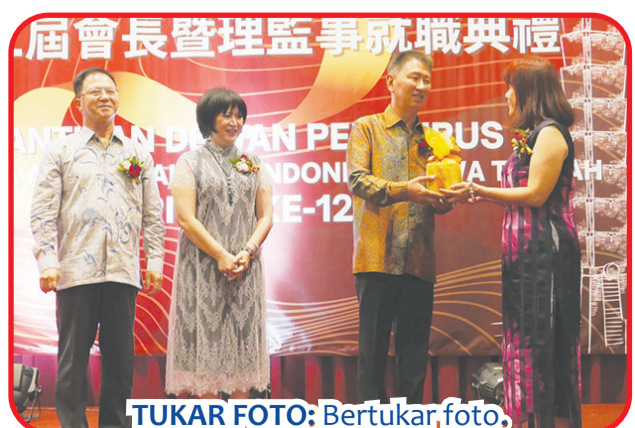
TUKAR FOTO: Bertukar foto.